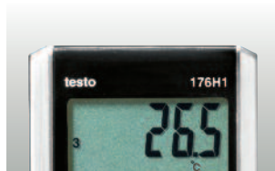
Большой четкий дисплей для отображения значений измерений