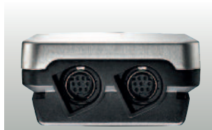
Разъемы для подключения двух внешних зондов температуры/влажности (в нижней части корпуса)