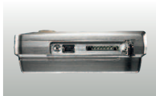
Разъем для подключения Мини-USB кабеля и SD- карты